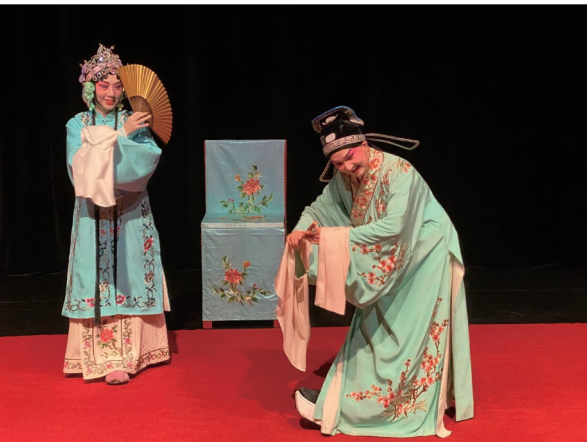
崑曲博物館2021年堂會，拾翠坊崑劇團演出《紅梨記·亭會》