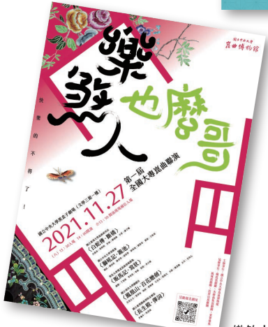
樂煞人也麼哥 活動海報