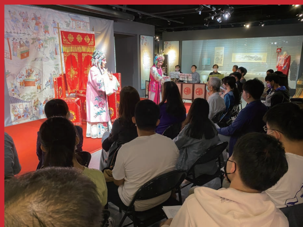
2021年堂會，鳳城崑劇團演出《西廂記·跳牆著棋》